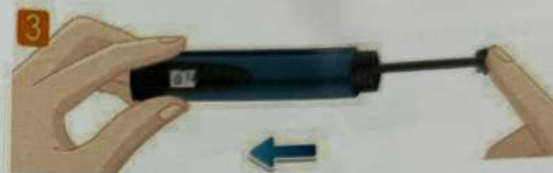
Отодвиньте ходовой винт до упора

Примечание: Если ходовой винт вышел, используйте палец, чтобы вернуть его. Ходовой винт вашей новой шприц-ручки может быть не на месте. Только тогда, когда шприц-ручка прикреплена к держателю картриджа, нажмите на кнопку введения инъекции, после чего ходовой винт переместится вперед.