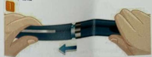
Снимите колпачок шприц-ручки