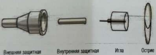
Внешняя защитная насадка иглы Внутренняя защитная насадка иглы Игла Острие

Игла для шприц-ручки (приобретается отдельно)