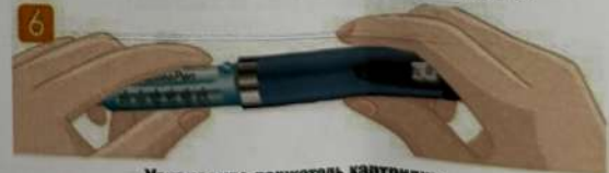
Установите держатель картриджа

Удерживая держатель картриджа, вставьте картридж, как показано на рисунке.