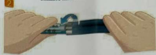
Открутите держатель картриджа, чтобы отсоединить его